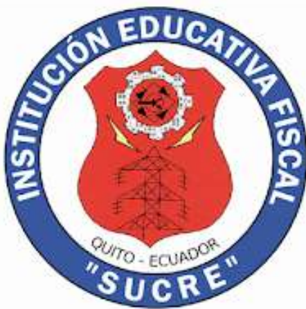
FIGURA PROFESIONAL ELECTRONICA DE CONSUMO PROPUESTA INNOVADORA